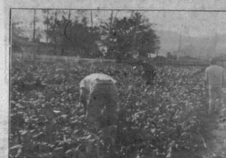
Tudo pronto para a colheita.