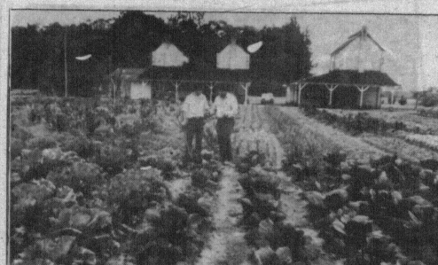
Os técnicos acompanham o desenvolvimento da plantação.