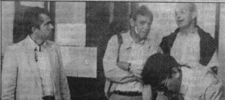
Ao fundo, os três integrantes da missão francesa.