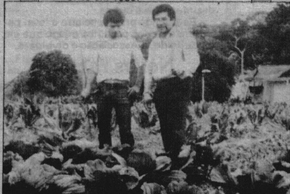
As hortaliças prontas para colheita.

Foi então, elaborado o processo criando a Escola Técnica do Vale do Itajaí — Etevi, cuja mantenedora seria a Furb. Apreciado pelo Conselho Estadual de Educação, o curso foi aprovado na sessão plenária de 25/02/75 (Parecer 14/75). Em outubro de 1974, a Furb adquiriu, por doação, o Campo Experimental da Cia. Souza Cruz, com 86.100 m 2 e benfeitorias, situado no Km 15 da rodovia Jorge Lacerda, no município de Gaspar. As atividades práticas do curso seriam desenvolvidas neste local. Por motivo de ordem financeira, o curso de Agropecuária foi implantado somente em 1980.