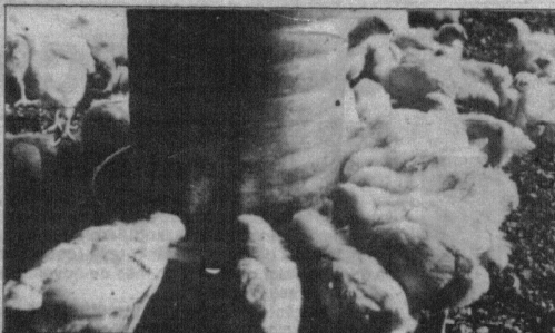
O crescimento das aves depende da boa alimentação