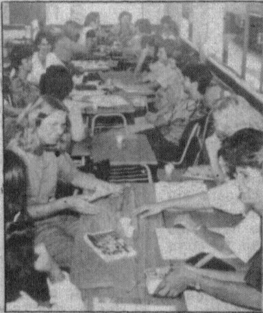
Participantes da I Semana de Matemática da Furb.

— Um projeto integrado Furb/4ª Ucre, de formação de monitores para as várias SLES da 4ª Ucre, que possibilitem atividades de divulgação e multiplicação dos esforços empreendidos para melhorar o nível de ensino de Matemática.