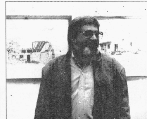
Melo não se limita a uma técnica. Explora o desenho, a aquarela, o óleo, a gravura, o naquim, procurando descobrir novos caminhos.

Mesmo estando mais inclinado ao desenho e à aquarela, tem pesquisado vários caminhos através do óleo, gravura, naquim, modelagem em barro e colagem. Melo concilia sua vocação artística com as atividades de professor titular de Hermenêutica e Aplicação do Direito e assessor de Pós-Graduação da FURB.