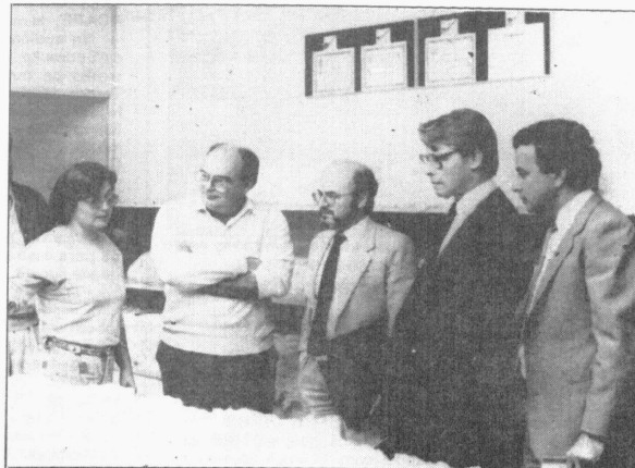
O CNPq, que está financiando projetos do IPT e Projeto Crise vieram conhecer de perto os trabalhos em andamento.