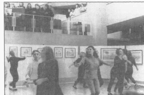
A arte se apresentou sob diversas formas. As pinturas de Mrosk e "Arca de Noé" encantaram o público presente.