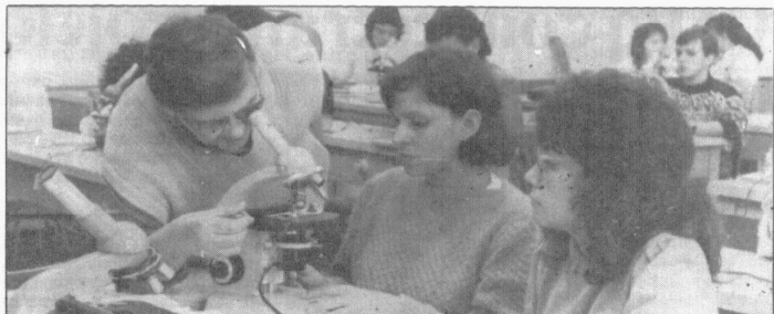
Com uma visão 100 vezes maior do objeto estudado, as lentes objetivas acromáticas estão permitindo pesquisa mais profunda.

Em sua audiência com o ministro da Educação, o reitor assinou convênio, através da ACAFE, para a liberação de Cz$ 40 milhões, ainda este ano, para obras, laboratórios, equipamentos, biblioteca e manutenção de FURB. Ele também acompanhou o andamento de projetos em tramitação no CNPq, FINEP, FIPEC a capacitação instrumental do IPT, o sensoramento remoto do Projeto Cria, a construção de um laboratório de controle de qualidade no Centro Tecnológico e a informatização da FURB.